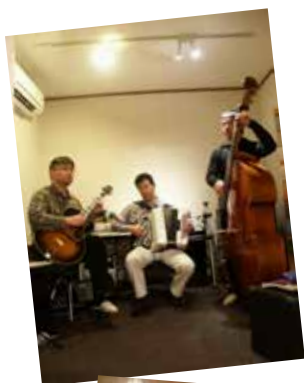
▲ 定期的なレコーディングなどでも演奏をしやすい空間。さすがの腕前です!