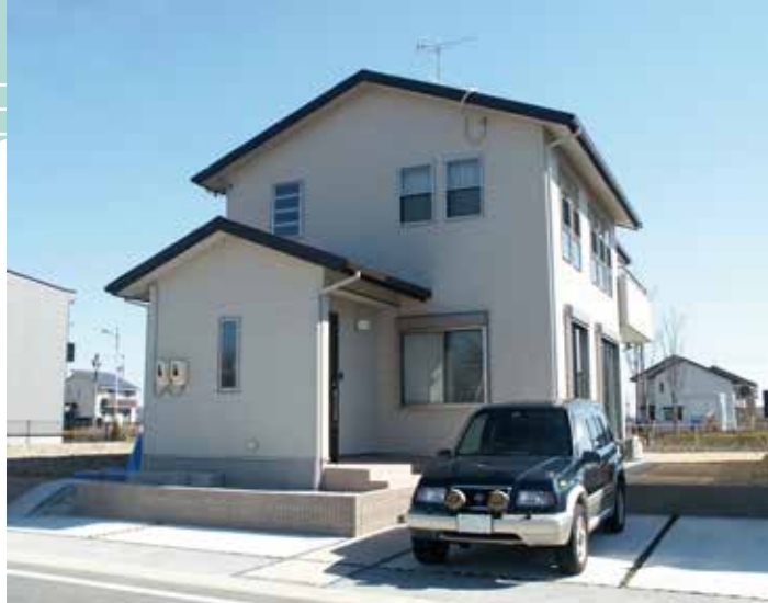
▲ 青空に映える、白を基調としたシンプルで爽やかな外観。

また、子供と一緒に過ごせる空間が欲しかったという奥様はキッチンの前に広めのカウンターをつくり、将来はそこでお子様が宿題をやったり、絵を描いたり、キッチンで家事をしながらも親子一緒に過ごせるよう工夫をしました。さらに、キッチンからの見通しがよいLDKは、自然と家族の様子に気を配ることができるようになっています。