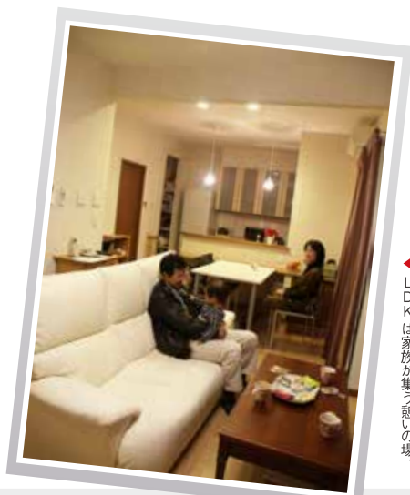
▲ 見通しのよい広々としたLDKは家族が集う憩いの場。