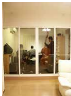
リビングと隣接する防音室は、家族と一緒に空間を共有できます。

そんな快適な住まいで、大好きなジャズをBGMに音楽に包まれた暮らしを楽しんでおられるM様。最近歩き始めたばかりの1歳になるお子様も、何年後かには親子で一緒に演奏する日も来るかもしれません。ますますこれからの暮らしが楽しみなご一家のマイホームです。