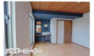
パウダーコーナー

「多すぎて、ちょっと迷いますが(笑)、あえて選ぶなら、寝室のパウダーコーナーですかね。イメージ通りカッコ可愛く仕上がっていますので、是非ご覧ください。」