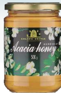
49 ハンガリーアカシア蜂蜜 500g