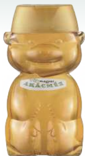
47 ハンガリーアカシア蜂蜜 250g クマ

ハンガリー最大手の蜂蜜生産者だからできる、高品質でありながらお求めやすい天然蜂蜜です。ハンガリーに自生する広大なアカシアの森に咲くアカシアの花からミツバチ達が集めた蜂蜜です。美しい透明感のある黄金色、クセのない味わいで、料理、飲み物の甘味料として幅広くお使いいただけます。身体に良いだけでなく、自然が生み出す上品な甘味と酸味の複雑な味わいが特徴です。ホッと一息つきたいときに、リラックスしてお楽しみいただける、ハンガリーが誇る高品質な天然蜂蜜です。