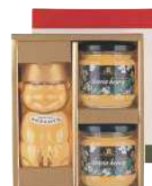
53 ハンガリーアカシア はちみつ(250g)3個入り