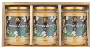
50 ハンガリーアカシア はちみつ(500g)3個入り