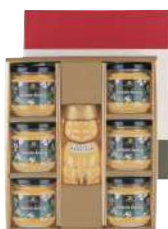
51 ハンガリーアカシア はちみつ(250g)7個入り