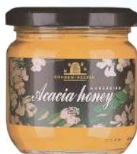
48 ハンガリーアカシア蜂蜜 250g