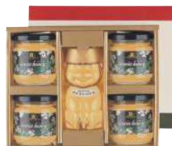
52 ハンガリーアカシア はちみつ(250g)5個入り